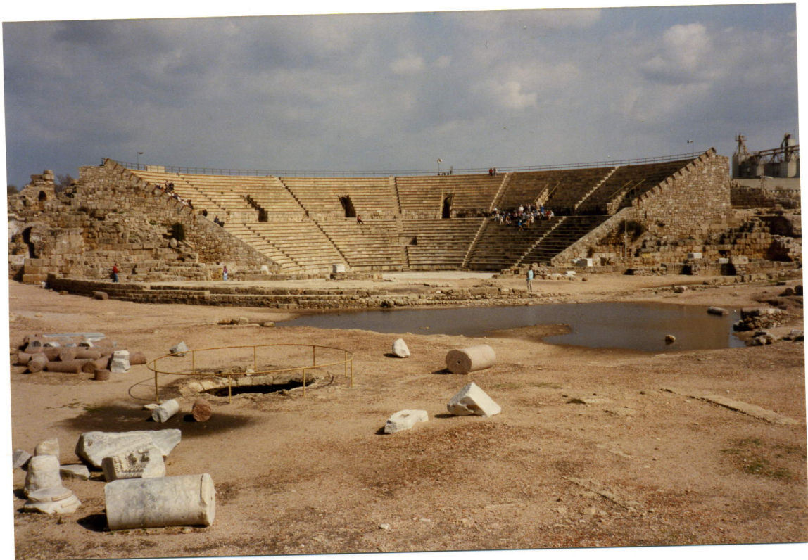
Vi så også den gamle KORSFARERFÆSTNING.